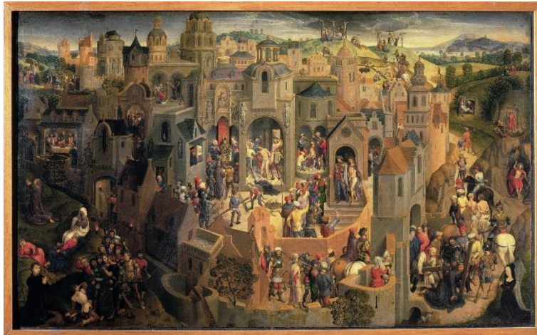
Hans Memling: de Lijdensweg

Nadien nemen we de tijd voor een bezoek aan de Bibliotheca Reale . Avondmaal in ons hotel en overnachting.