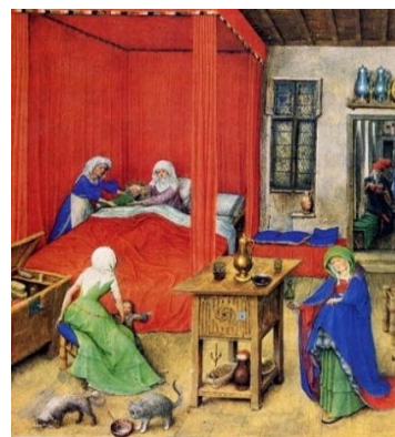
Jan Van Eyck: geboorte van Johannes de Doper

Avondmaal in een wijnrestaurant en overnachting.